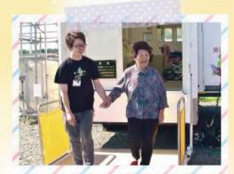
リフト付きで高齢者も安心!