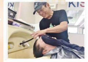
「窮屈な仮設住宅暮らしの中でも気持ちスッキリした!」「久しぶりの美容室で本当に気持ちよかった」と多くの方に喜んでいただくことができました!