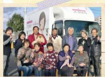
きずな号をバックに写真撮影!