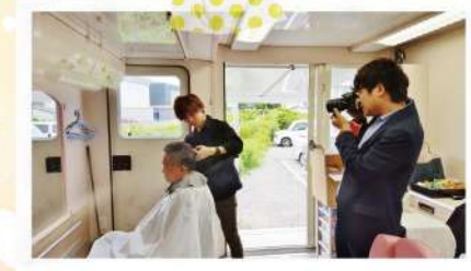
現地TV局や新聞社などのメディアも取材にいらっやいました!