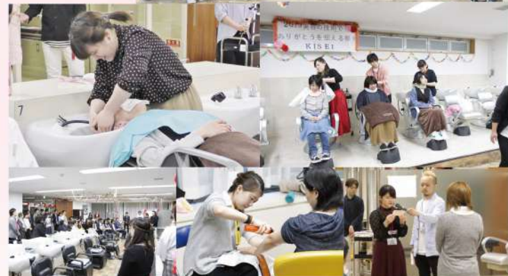
先輩スタイリストもウルウル…