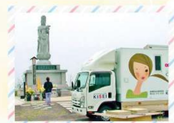
東日本大震災慰霊塔