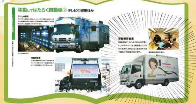
「ポプラディア大図鑑 WONDA 車・飛行機・船」発行:株式会社ポプラ社 定価2,000円+税 平成26年6月発行/初版6,000部