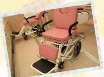
バリアフリーにこだわった設備!