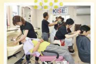
シャンプー台完備でパーマ、カラーもOK!