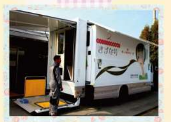
3トラックの横幅が1.5倍に拡幅!